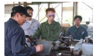
特殊金属加工演習(実習)