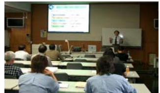
デジタルエンジニアリング基礎論(講義)