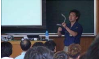
加工学基礎論(講義)