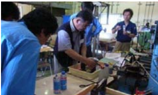
溶接非破壊検査(実習)