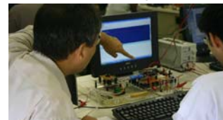
コンピュータ利用技術演習