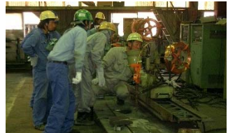
特殊溶接演習(実習)